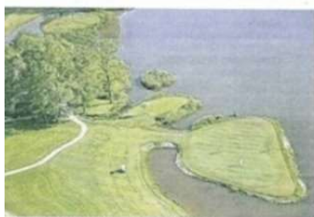
golf de l'Ermitage à Vendeuvre et son tour signature : le trou n° 18.

Un succès qui ne doit pas forcément à la qualité de son parcours, plutôt un cran en dessous des deux autres. « À cause de son sol argileux, il est sensible aux variations climatiques. Les sentiers ne s'aprycricient pas toujours, parce qu'il est assez long, plus, avec peu de forêt. Ce n'est pas le plus beau », conclut notre intervenant.